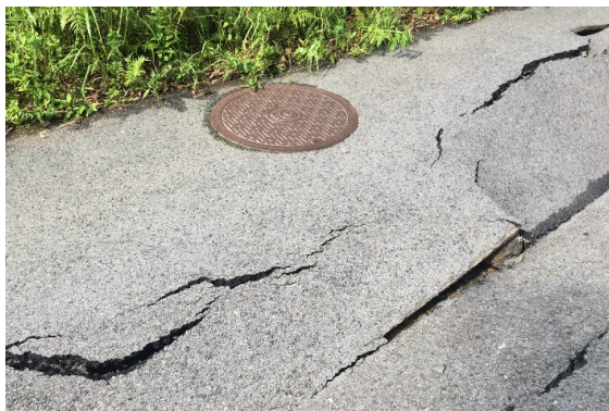
※マンホール付近の道路陥没（奄美市朝戸）