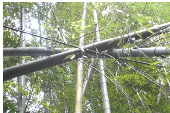
※通信ケーブルへの倒木（霧島市牧園町）