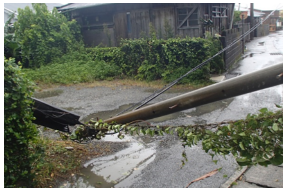
※電柱の倒壊（大島郡龍郷町円）