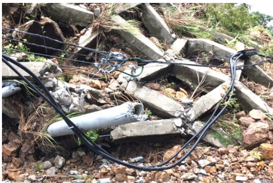
※電柱の倒壊（奄美市笠利町）