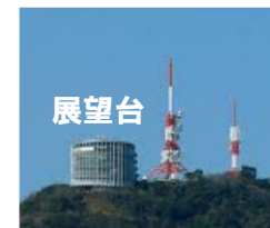
稲佐山展望台までは光設備が構築されている。