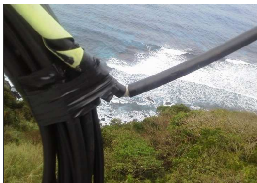
※ケーブルの損傷（奄美）