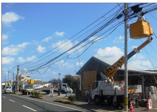
※ケーブルの張り替え作業（沖永良部）