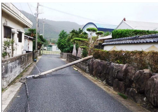
※強風による電柱の倒壊（奄美）