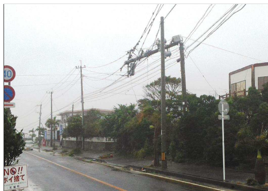
※強風による電柱の損傷（徳之島）