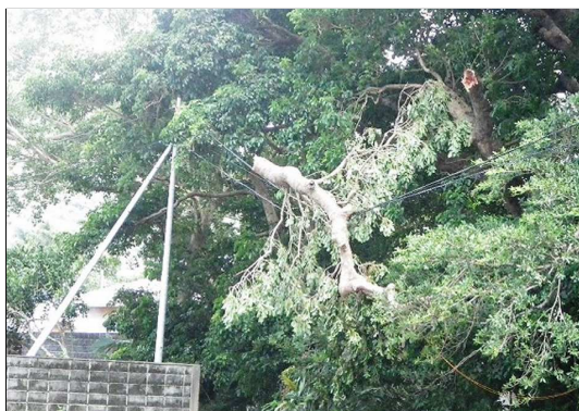
※倒木によるケーブルの損傷（瀬戸内）