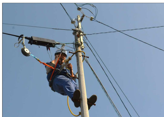
※電話線一本一本の接続作業（沖永良部）