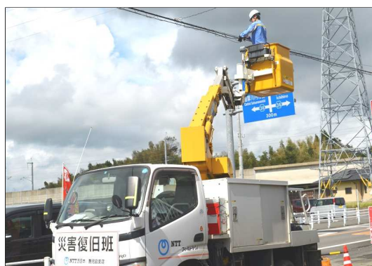
※通信ケーブルの接続作業（薩摩川内市）8/31