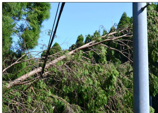
※倒木で損傷した通信ケーブル（日置市）8/25