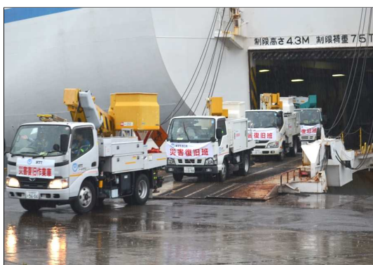
※到着した広域支援（志布志港）8/29