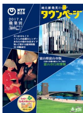
富山県富山市版「タウンページ」

また災害時の通信手段を確保する観点から、公衆電話設置場所も記載しています。（2016年10月現在）