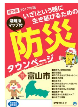
別冊「防災タウンページ」 (富山市版)