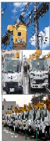
〈県外からラジールで到着した支援車輛 (昨年)〉