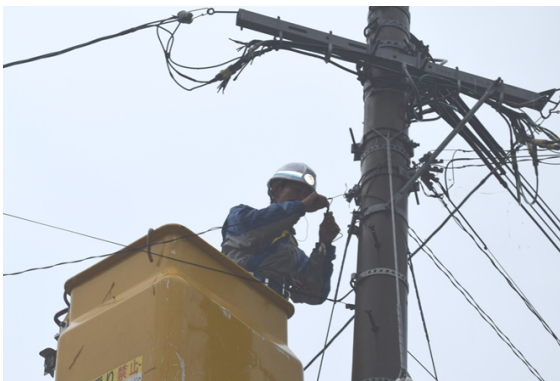
※一軒一軒の故障修理（鹿屋市）8/15