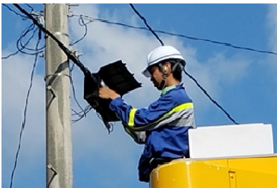
※一軒一軒の故障修理（屋久島町）8/10