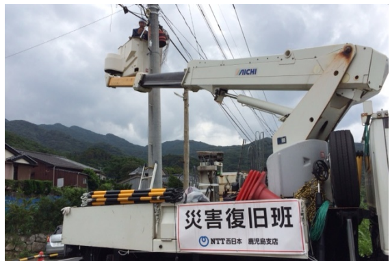
※通信ケーブルの復旧作業（屋久島町）8/15