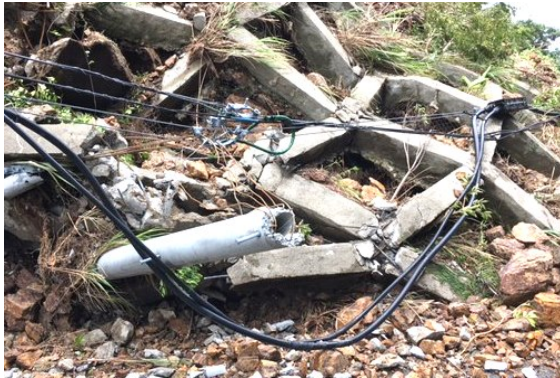
※電柱の倒壊（奄美市笠利町）8/7