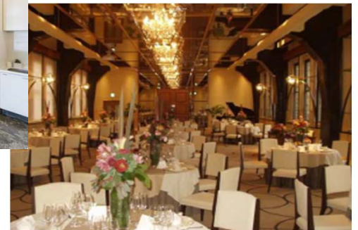
ブライダルレストラン(兵庫:芦屋)