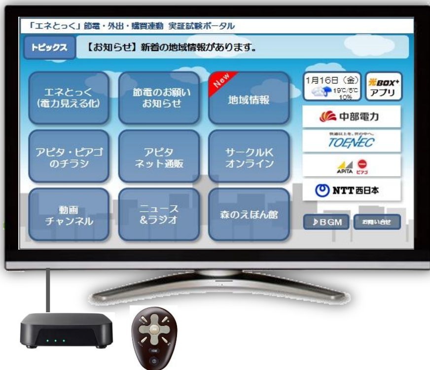
ホーム画面 (通常時)