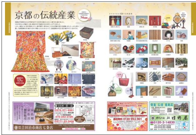
京都市北中部版「タウンページ」内、巻頭特集「京都の伝統産業」ページの一部