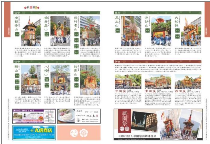
京都市北中部版「タウンページ」内、巻頭特集「祇園祭」の一部

昨年版、巻頭特集として掲載した「祇園祭」が好評につき、今年発行版では、さらにページを追加、見開き 10 ページにわたり、 「三十三基の山鉾と三基の神輿」を一覧として掲載 しました。