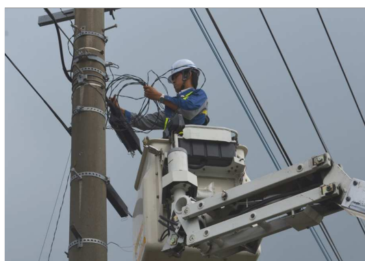
※一軒一軒の故障修理（南さつま市）