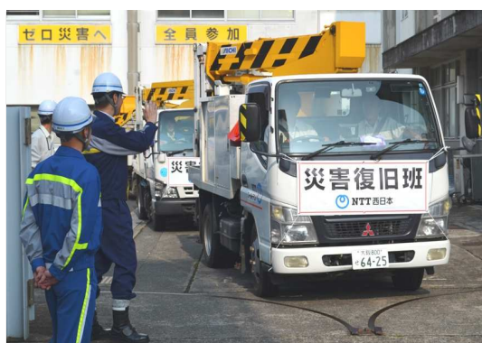
※出動する災害復旧班（南さつま市）