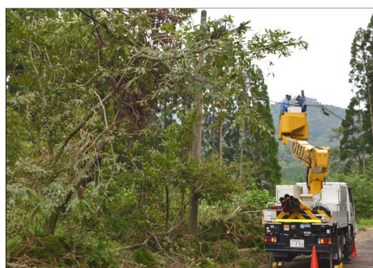
※倒木現場での接続作業（出水市）