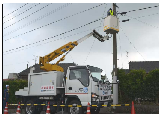
※県外支援班による復旧作業（南さつま市）