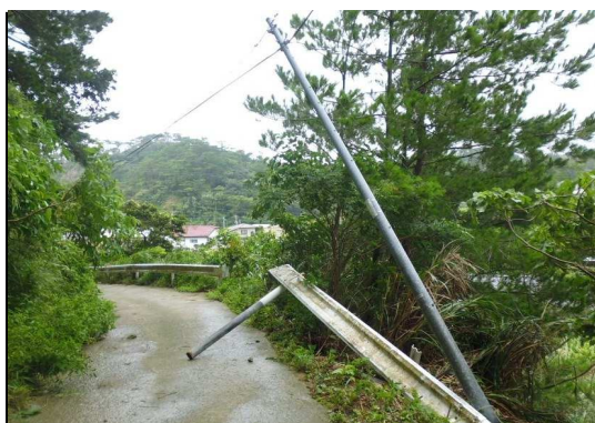
※土砂崩れによる電柱の倒壊（徳之島町）