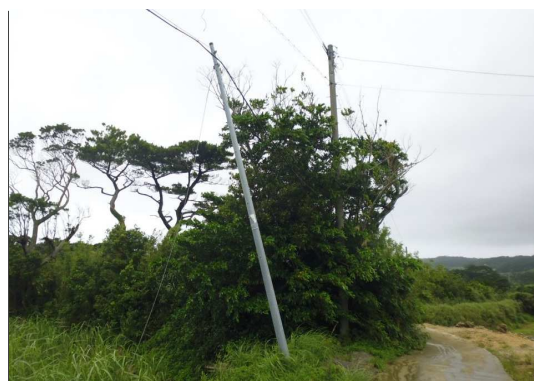
※強風による電柱の傾斜（伊仙町）