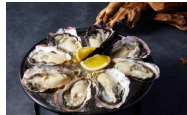
旬の生ガキ 税込み 594円/1個~