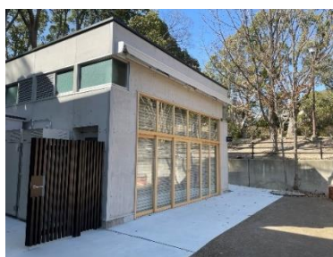
コミュニティスペース外観写真