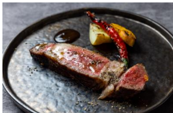
国産銘柄牛の炭火焼きステーキ 税込み 2,178円

肉イタリアン&オイスターというコンセプトのもと、“上質な健康赤身肉の炭火グリル”や全国の契約生産者から届く“生牡蠣”など