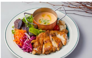
ハーブチキンと旬野菜のサラダ仕立て 税込み 2,068円

ランチ：午前11時~午後3時 全30種の惣菜パンと焼きたてパンを楽しむパン食べ放題ランチ