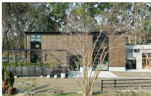
「1000RE SCENES (センリシーンズ)」外観