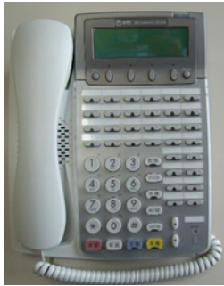
< 装置正面 >